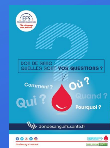
Affiche salle d'attente